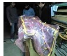
真空引きによる圧着後、加熱