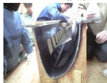
カーボンプリプレグを積層