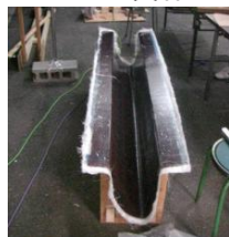
オス型にGFRPを積層して型をとる