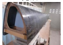
翼の前縁部に接着

現在は2010年夏の鳥人間コンテスト優勝を目指して、テストフライトを繰り返し、機体の調整に励んでいます！！